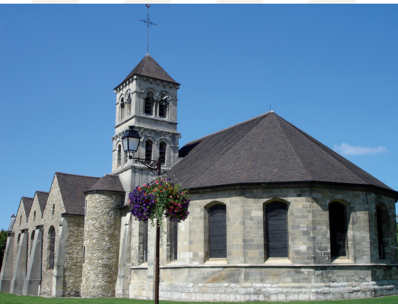
L'extérieur de nos jours - Vue sur le chevet octogonal.