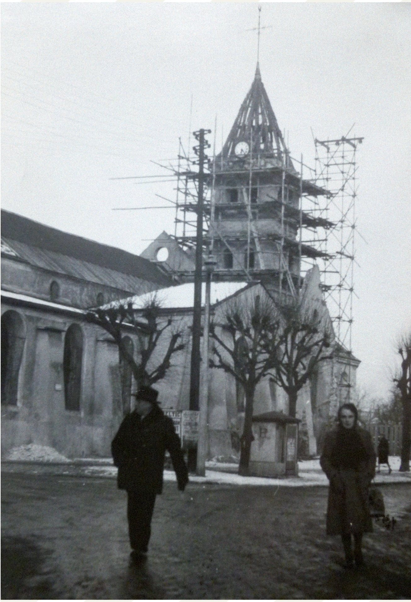
Le chevet et le clocher font l'objet des premiers travaux.