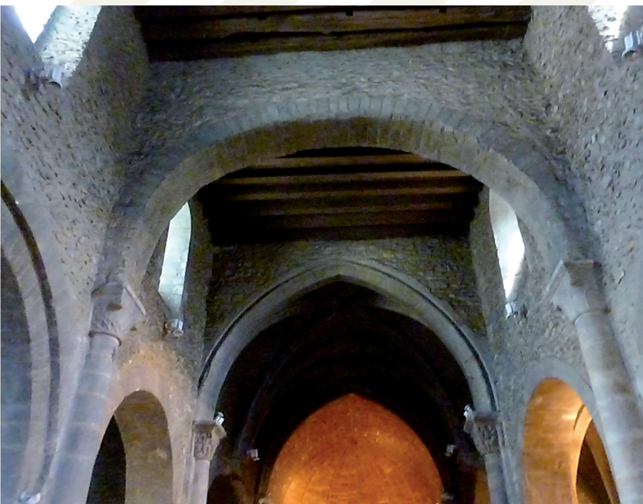
La nef avec son plafond de bois et ses arcs romans. Les arcs gothiques n'apparaissent qu'au niveau du transept puis dans le chœur.