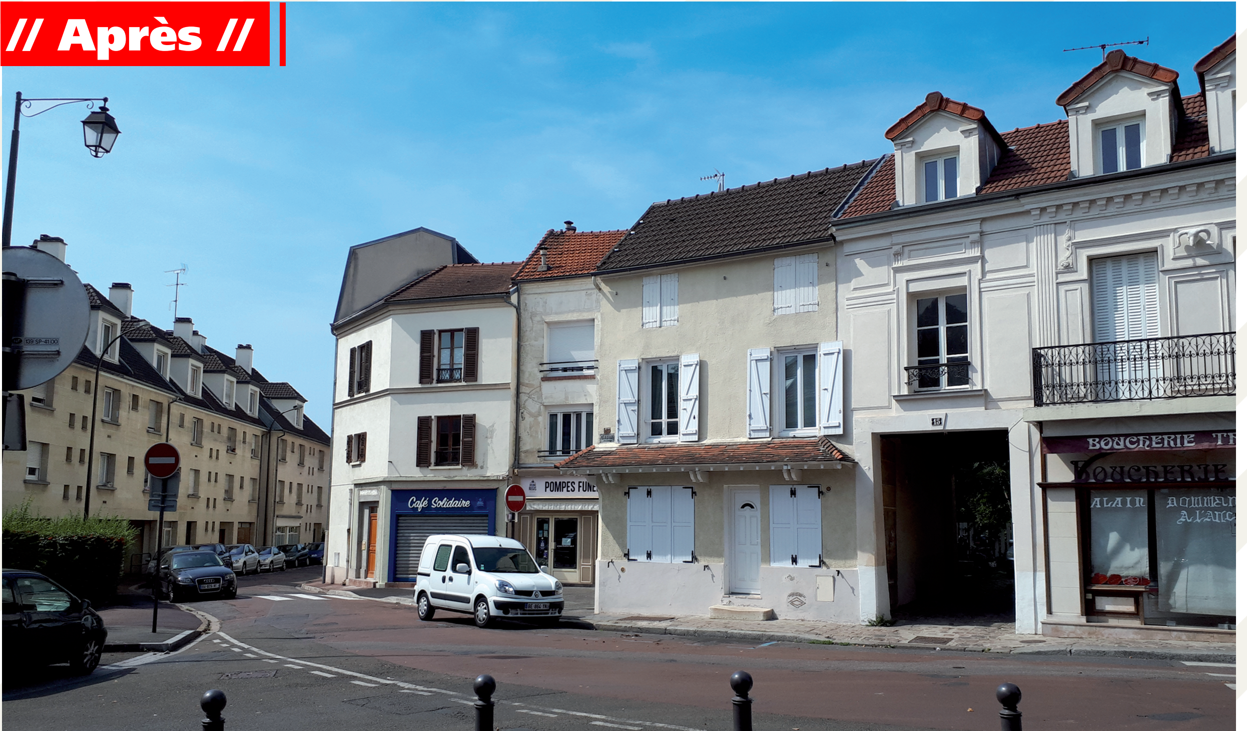
Rue de l'Église - Août 2017. À gauche, les immeubles de « l'îlot » aménagés dans les années 50 et 60. À droite, des maisons anciennes restaurées après leur destruction partielle.