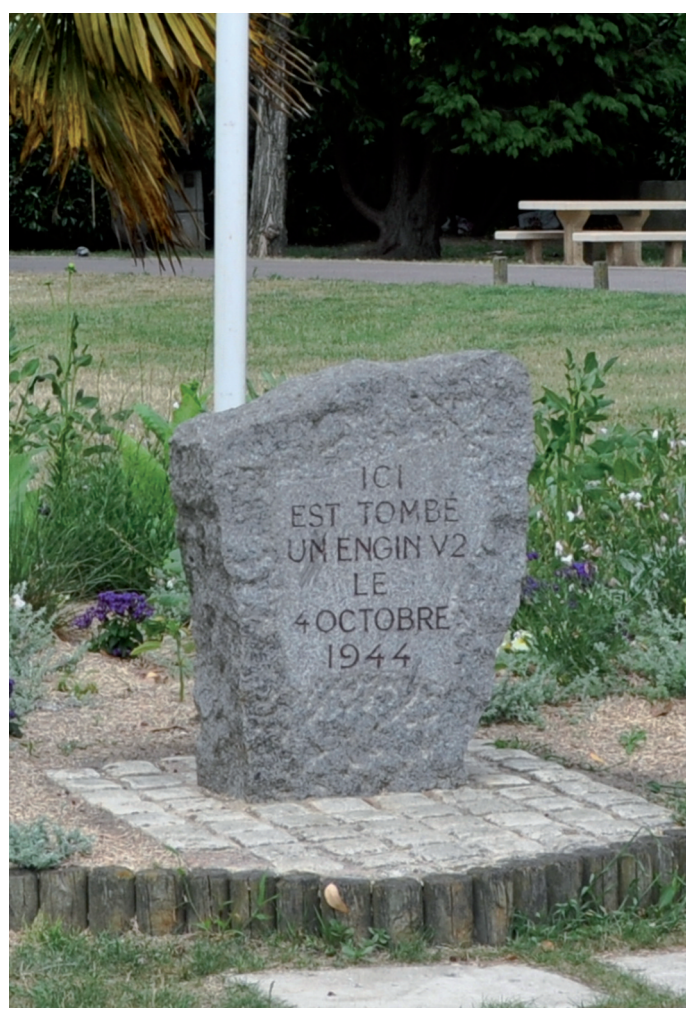
Fontaine et monument commémoratif Place des Victimes du V2

◆ La rue Charles-de-Gaulle percée dans le prolongement de la rue Cauchoix et l'ancienne Rue de l'Église redessinée enserrant désormais une sorte d'« îlot » où sont construits de petits immeubles, une place, et des commerces. On y retrouve la boulangerie et la pharmacie qui avaient été totalement détruites.