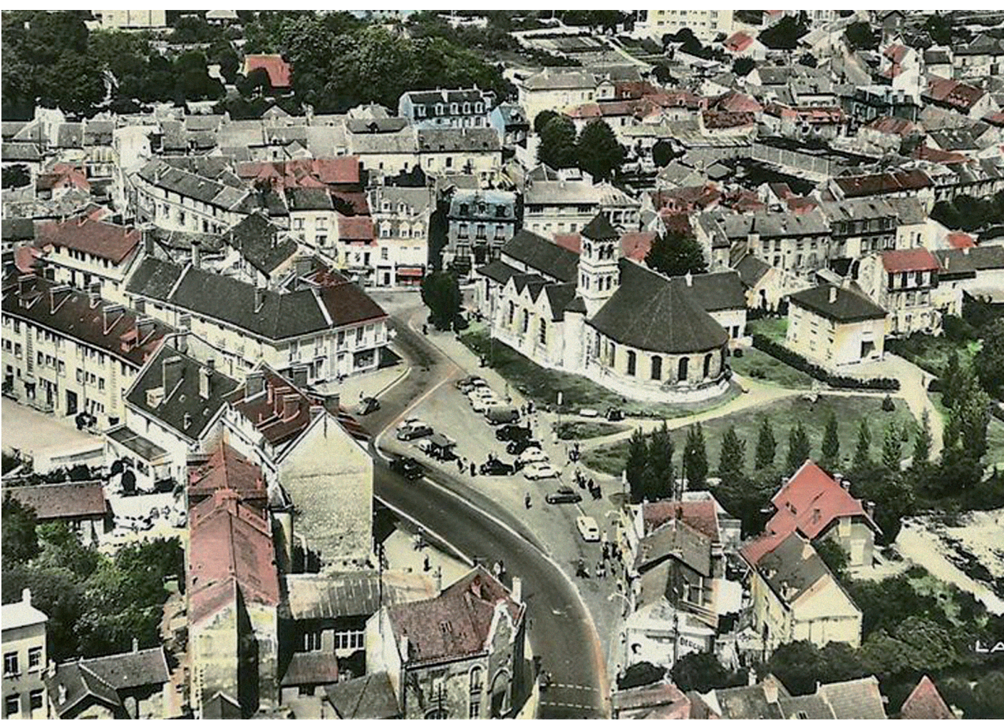
Rue Charles-de-Gaulle terminée.